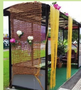
Busskur vid Coop Extra.