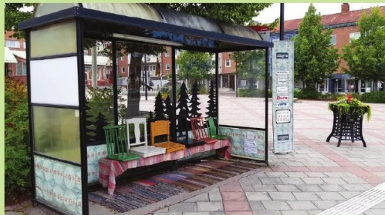
Busskur vid kommunhuset.

Samåkandet har också hälsofördelar då det leder till att det uppstår färre partiklar från avgaser, slitage från vägar och däck som förorenar luften vi andas. An-