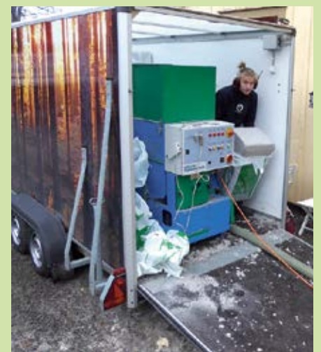
Bilsläpvagn med isolermaterial och fläktaggregat.

I hus med torpargrunder är kalla golv ofta ett problem. Staffan berättar, att de har gjort isoleringar av torpargrunder underifrån, genom att ta upp hål och blåsa