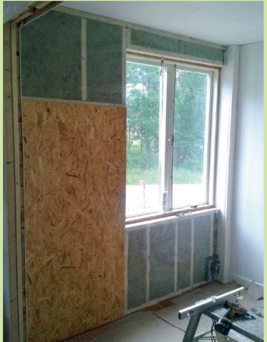
Invändig tilläggsisolering av vägg kan halvera energiförlusten genom väggen men är förknippat med fukttekniska risker.

På Energimyndighetens hemsida www.energimyndigheten.se kan du söka på "webshop" och där gratis ladda ner broschyren "Att tilläggsisolera hus - fakta, fördelar och fallgropar"