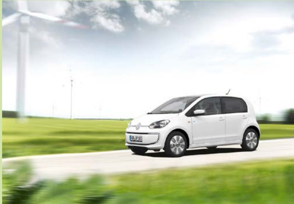
Volkswagens elbil e-Up.

Vi har provat en del och fått bra resultat, många verksamheter med flera fordon kan komplettera elbilar med någon vanlig bil för de där gångerna man behöver extra räckvidd. Elbilen och hybriderna blir vanligare och vanligare ute på gatorna, att anpassa sig