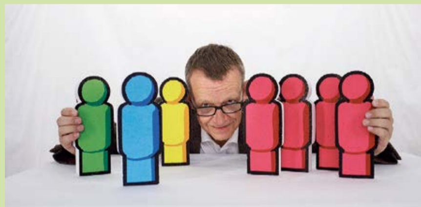
Hans Rosling.

Genom att använda animationer av globala trender föreläser Hans Rosling om historiska och samtida ekonomiska, sociala och miljömässiga förändringar i världen. Hans prisbelönta föreläsningar om globala trender har beskrivits som "humorous, yet deadly serious" och många i publiken finner att deras egen världsbild är många decennier för gammal.