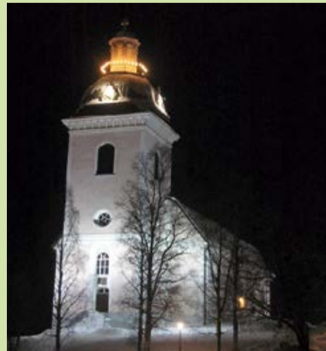
I Färila kyrka kommer ljuset att släckas under Earth Hour. I Järvsö kyrka och Ljusdals kyrka släcks också ljuset under Earth Hour.

Fri entré. Varmt välkomna till Färila kyrka!