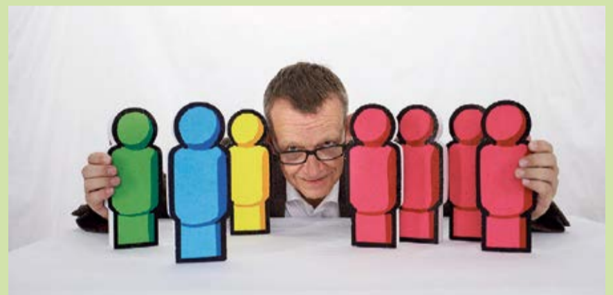
Hans Rosling.

Genom att använda animationer av globala trender föreläser Hans Rosling om historiska och samtida ekonomiska, sociala och miljömässiga förändringar i världen. Hans prisbelönta föreläsningar om globala trender har beskrivits som "humorous, yet deadly serious" och många i publiken finner att deras egen världsbild är många decennier för gammal.