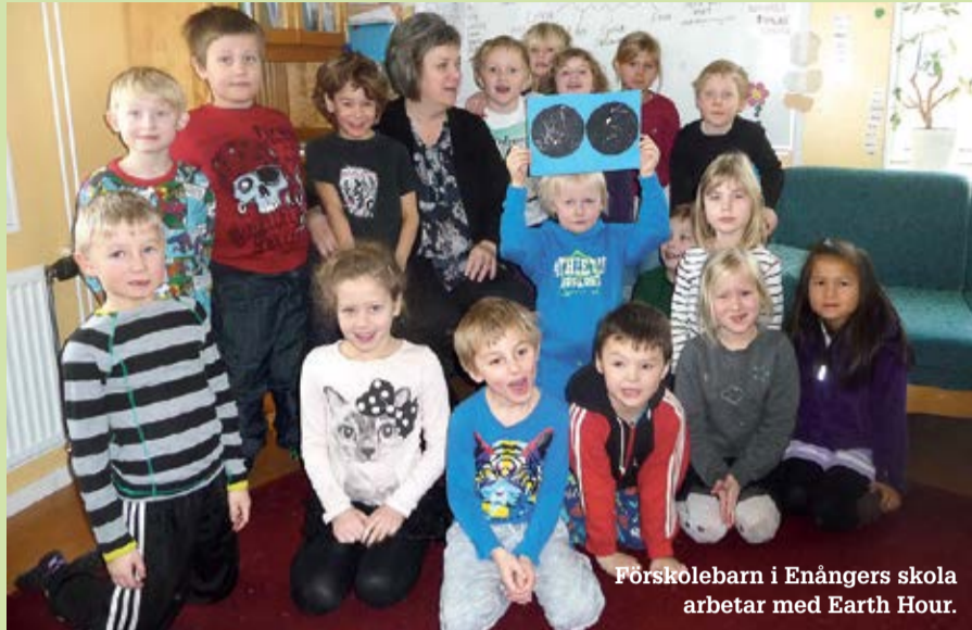
Förskolebarn i Enångers skola arbetar med Earth Hour.